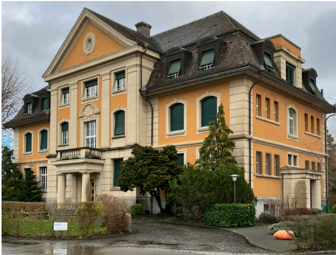
Ein herrschaftlicher Bau: Die Villa Kunz auf dem ehemaligen Spinnereiareal in Unterwindisch.

Hinter der denkmalgeschützten Villa Kunz soll neuer Wohnraum entstehen. Nun liegt das Richtprojekt vor. Für die nötige Anpassung des Gestaltungsplans läuft bis Ende Juni eine öffentliche Mitwirkung.