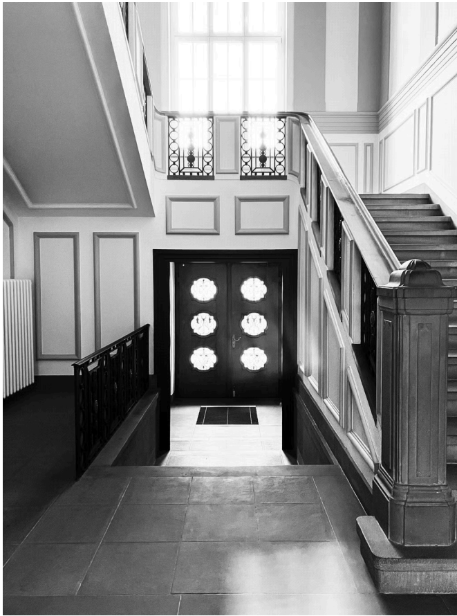
Stilvoll: Haupttüre und Treppenaufgang im Innern der Villa Kunz.

In einem Längsbau, der sich bezüglich Dachform und Geschossigkeit an die denkmalgeschützte Villa anlehnt, sollen Wohnungen entstehen. Die Villa selbst, so schlägt der Projektbeschrieb vor, soll einem sanften Umbau unterzogen werden.