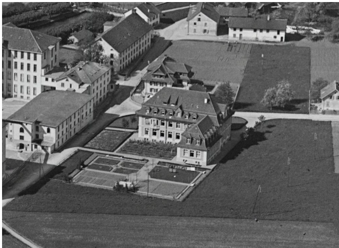
So sah das Areal rund um die Villa Kunz (Mitte) 1917 aus.